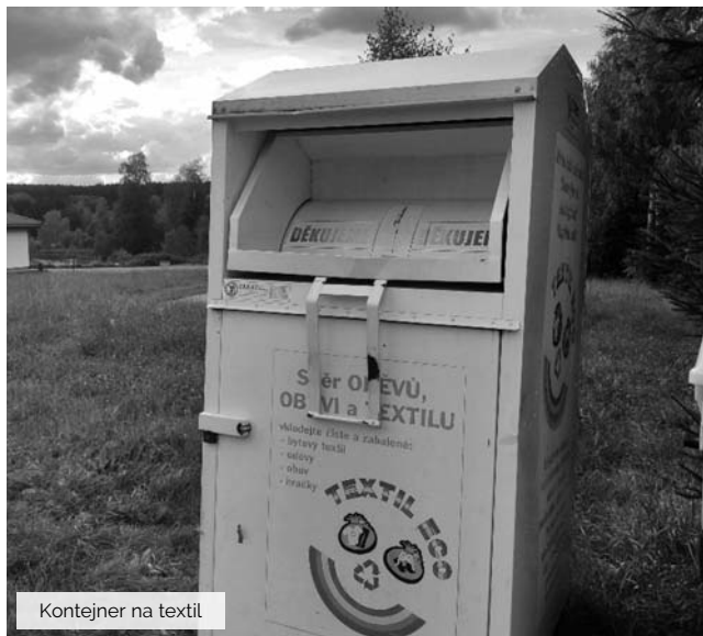
Kontejner na textil